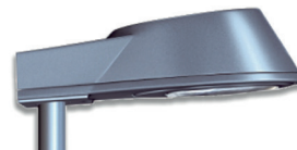
Mastaufsatz Ø 76 mm

Entwickelt für normgerechte Ausleuchtung von Straßen, Wegen und Plätzen gemäß EN 13201.