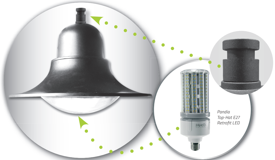
Pandia Top-Hat E27 Retrofit LED